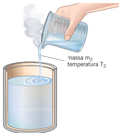
Figura 2 Aggiunta dell'acqua calda.

Poi scaldiamo una seconda massa m_2 di acqua alla temperatura T_2 e la versiamo nel calorimetro che già conteneva l'acqua alla temperatura T_1 . Infine misuriamo la temperatura di equilibrio T_e raggiunta dalla miscela.