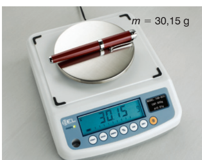
bilancia di laboratorio sensibilità 0,01 g