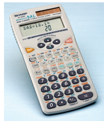
▲ Figura 1 Nel fare i calcoli, le calcolatrici non tengono conto del numero di cifre significative dei dati; quindi, anche se dopo la virgola vi sono zeri significativi, questi non vengono riportati. Il valore giusto da trascrivere è 20,0.