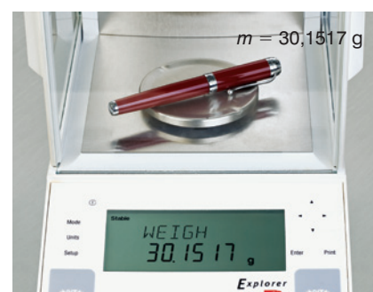
bilancia per uso analitico sensibilità 0,0001 g

Si potrebbe dire per assurdo che il valore vero della massa non esiste, o perlomeno che noi non siamo in grado di conoscerlo perché quello che possiamo conoscere è solo il valore misurato che dipende, come abbiamo visto, dallo strumento utilizzato. I tre dati forniti dalle bilance sono tutti e tre «giusti» ma tuttavia rappresentano tutti un valore approssimato.