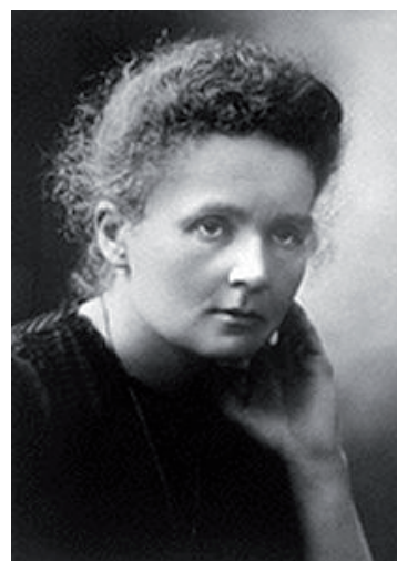
▲ Figura 1 Marie Curie

Proprio nel tentativo di studiare i raggi catodici, nel 1895 il fisico tedesco Wilhelm Röntgen compì una scoperta sensazionale: dopo avere coperto un tubo a raggi catodici con una carta nera che non lasciava fuoriuscire i raggi, si accorse che una lastra fotografica posta nelle vicinanze veniva ugualmente impressionata. In questo modo aveva casualmente scoperto l'esistenza dei raggi X. Si tratta di onde elettromagnetiche di energia molto elevata, che attirarono l'interesse di molti scienziati, tra cui Becquerel, che aveva già compiuto studi sulla luce emessa da particolari cristalli fluorescenti e fosforescenti. Nel tentativo di verificare eventuali legami tra i raggi X e la fluorescenza, Becquerel decise di studiare il comportamento di alcuni cristalli di minerali di uranio che presentavano proprio il fenomeno della fluorescenza. Il giorno programmato da Becquerel per l'esperimento, però, pioveva e non era quindi possibile esporre i cristalli alla luce del sole per provocarne la fluorescenza. Il fisico allora ripose i cristalli e la lastra fotografica su cui avrebbe voluto rivelare i raggi X in un cassetto. Poiché continuava a piovere, qualche giorno dopo Becquerel decise comunque di sviluppare la lastra fotografica inutilizzata, come esperimento di controllo.